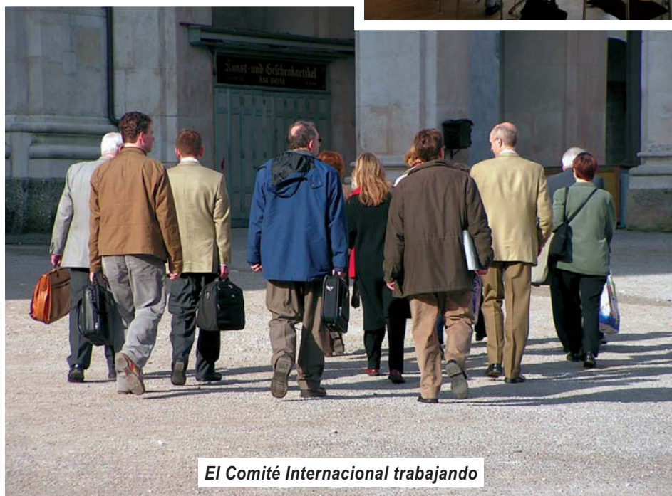
El Comité Internacional trabajando