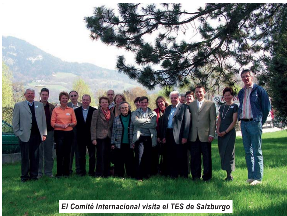
El Comité Internacional visita el TES de Salzburgo

El 14 de abril el Comité Ejecutivo también tuvo ocasión de encontrarse con todos los directores y representantes de los TES austriacos , quienes mantenían su reunión anual en Salzburgo ese mismo día. Esta reunión significó una muy buena ocasión de conocerse, presentar iniciativas y actividades de ambas organizaciones y de compartir opiniones acerca de los principales problemas con los que se enfrenta la Federación austriaca en estos momentos (vea el artículo de la página 3).