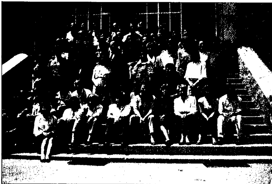
Participantes en los cursillos de Valladolid.

Están pintando y adecuando las aulas. Esperamos que dentro del primer semestre del año ya próximo, Valladolid inaugure el nuevo Teléfono de la Esperanza.