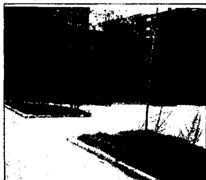
Sede del Teléfono, Albacete.