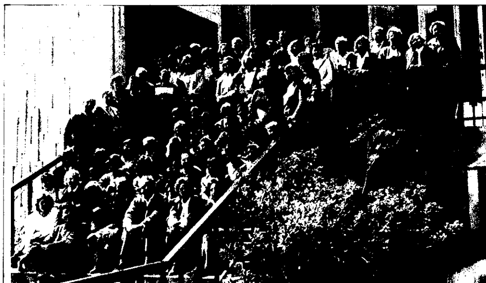
Curso de Comunicación, Mallorca, del 19 al 22 de abril.

Comunicación, en Valladolid, del 24 al 27 de mayo.